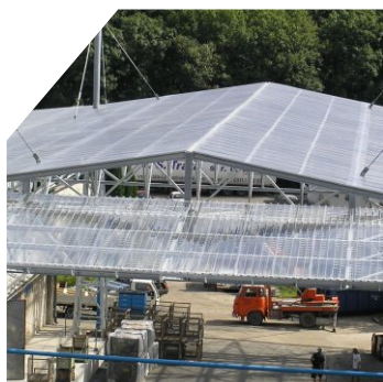
zastrešenie nákupných center